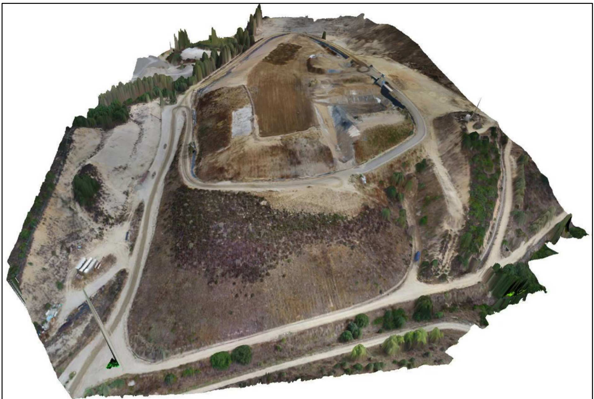
Figura 3: Vista 3D di Ortofoto 2021 plasmata sul DSM da Drone 2021