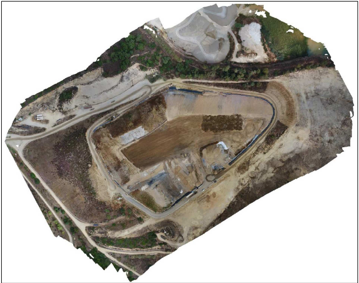
Figura 2: Ortofoto da Drone 2021